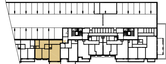
BYT Č. / APARTMENT NO. 221