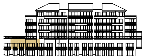
1.PP / -1ST FLOOR