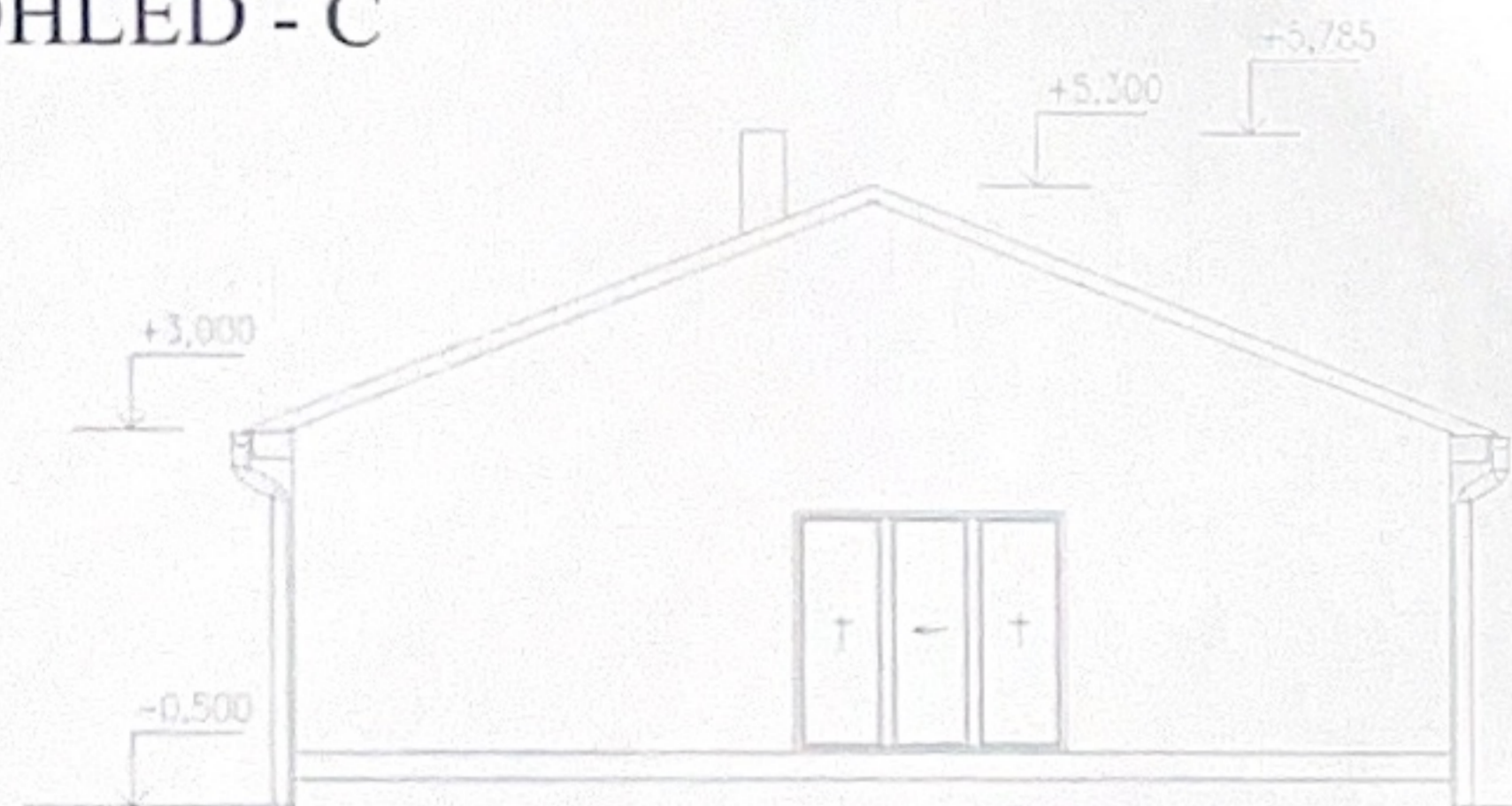
POHLED - C